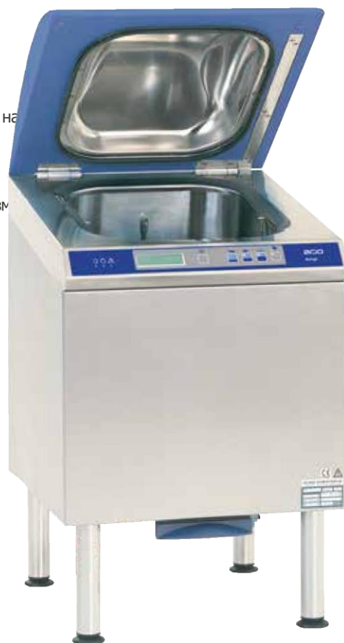
AMIGO – ДЕЗІНФЕКТОР ЗМИВУ З ВЕРХНІМ